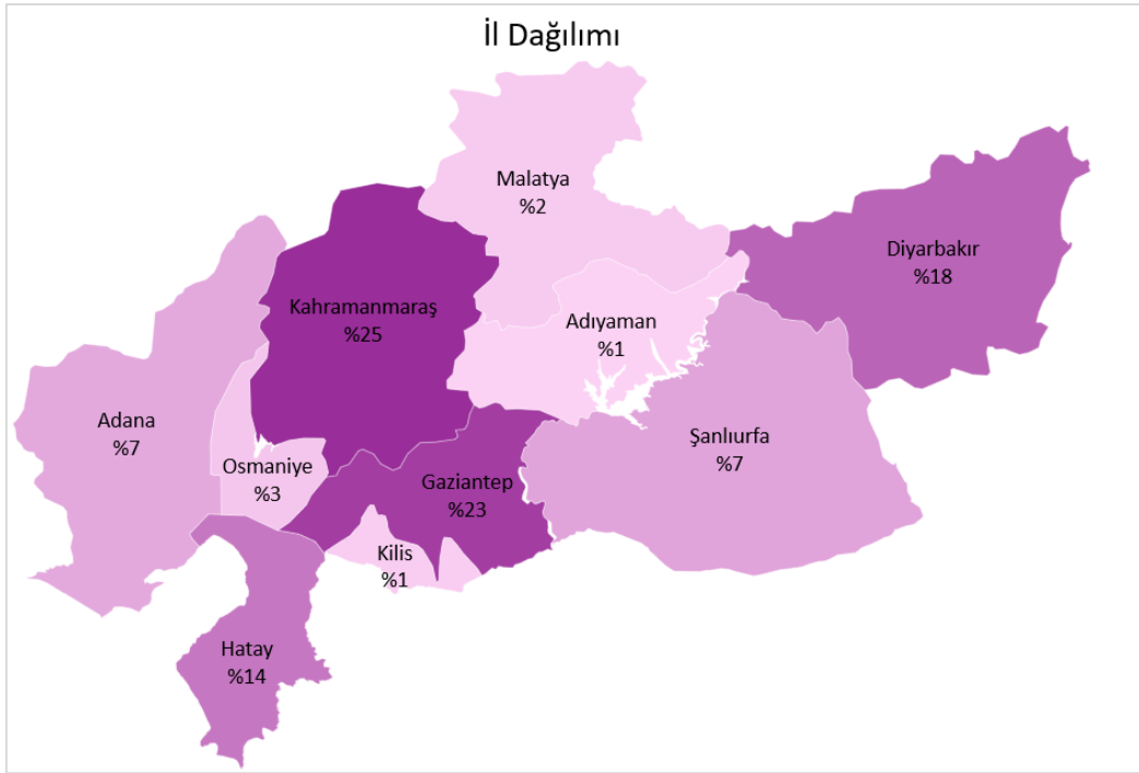
Şekil 1- İl Dağılımı

Görüşme yapılan mikrogişimci kadınların neredeyse yarısı 30-44 yaş aralığındadır. Katılımcıların %17'si 18-29 yaş aralığında, %23'ü 45-54 yaş aralığında ve %12'si 55 yaş ve üzerindedir.